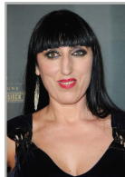
Rossy de Palma